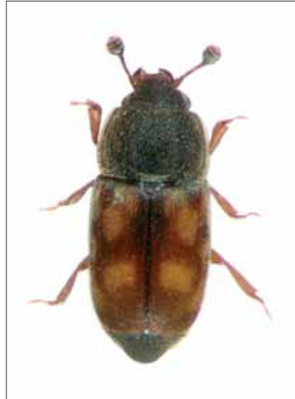
Abb. 2: Nitidula carnaria (SCHALLER, 1783), Feistritzklamm/Herberstein, Nat. Gr.: 3,1 mm.