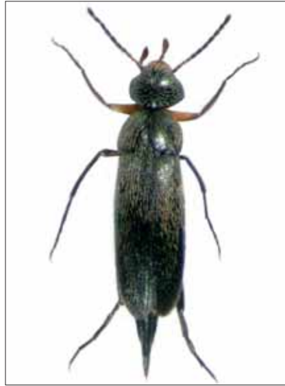
Abb. 6: Mordellistena bicoloripilosa ERMISCH, 1967, Feistritzklamm/Herberstein, Nat. Gr.: 3,8 mm.