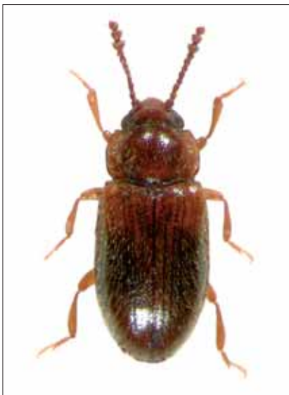
Abb. 3: Cryptophilus obliteratedus REITTER, 1874, Feistritzklamm/Herberstein u. Riegersburg, Nat. Gr.: 2,5 mm.