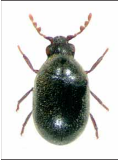
Abb. 5: Dorcatoma androgyna (BÜCHE, 2000), Feistritzklamm/Herberstein, Nat. Gr.: 2,7 mm.