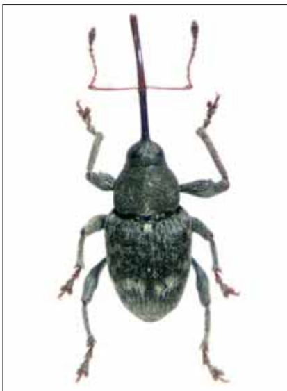
Abb. 7: Curculio villosus FABRICIUS, 1781, Feistritzklamm/Herberstein, Nat. Gr.: 4 mm. Fotos: Erwin Holzer.