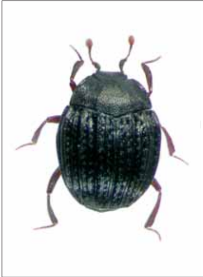
Abb. 1: Onthophilus affinis REDTENBACHER, 1849, Riegersburg u. Raabklamm, Nat. Gr.: 2 mm.