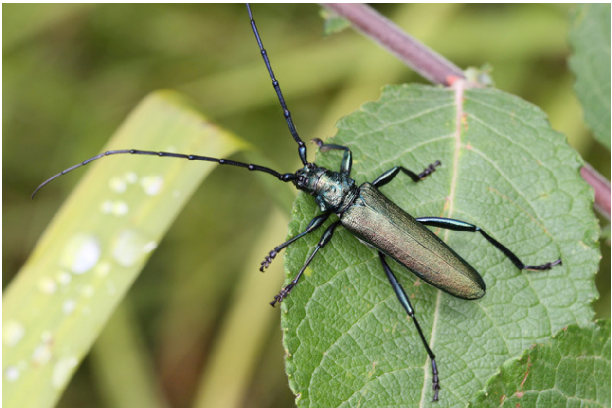
Moschusbock ( Aromia moschata )