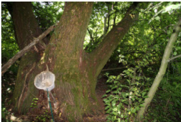
Abb. 1: Melanophthalma rispini wurde aus dem Mulm dieser mächtigen Weide am Ufer des Raab-Altarmes gesiebt.

Dritter Nachweis für die Steiermark! Die Revision des Melanophthalma taurica -Artenkomplexes aus der Familie der Latridiidae (Moderkäfer) durch RÜCKER & JOHNSON 2007 ergab drei weitere Arten. Melanophthalma rispini ist eine davon, der Holotypus der Art stammt aus Kärnten (Reifnitz, leg. C. Wieser, 1997). Die beiden anderen steirische Nachweise stammen ebenfalls aus dem Vulkanland: Bad Gleichenberg, südlich des Golfplatzes (2006) und Oberpurkla (2011).