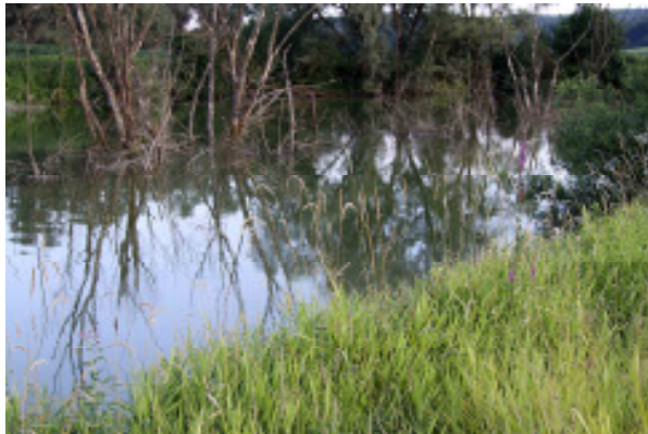
Abb. 3: Blutweiderich-Bestand am Altarm-Biotop an der Schafweide des NSG, Fundort von Nanophyes brevis

Diese ebenfalls seltene Art aus der Unterfamilie Apioninae/Spitzmausrüssler (Fam. Brentidae/Langrüssler) lebt monophag auf Lythrium salicaria (Blutweiderich). Die Larve entwickelt sich in den Früchten. Nanophyes brevis steht in den Roten Listen gefährdeter Käfer Österreichs (Kat. 4: potentiell gefährdet).